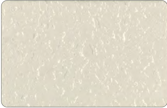
▲凹凸模様（吹付け工法） KP-127