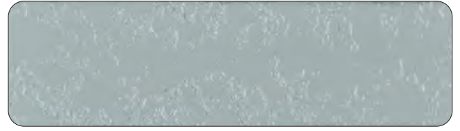
▲凸部処理模様（吹付け工法） KP-70