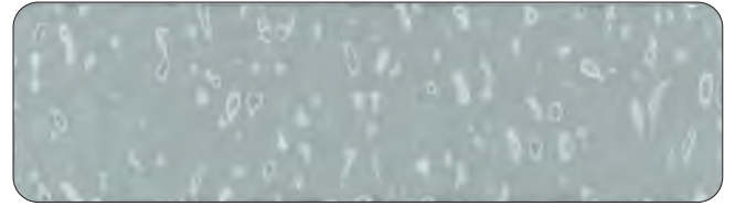
▲さざ波模様（ローラー工法） KP-70